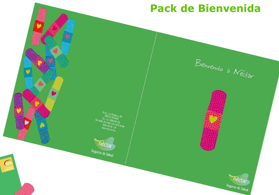
Pack de Bienvenida