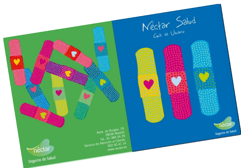
Guía de usuario