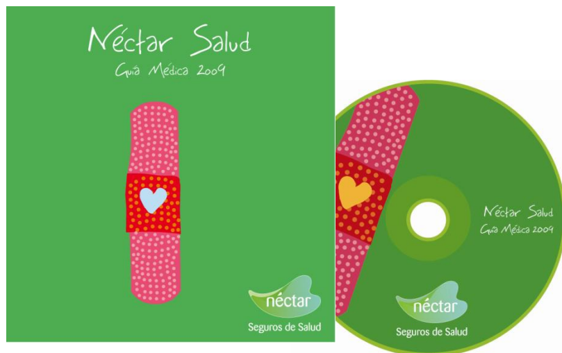
CD Cuadro Médico